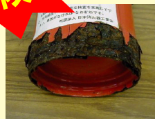
底が腐食した消火器