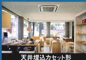
天井埋込カセット形